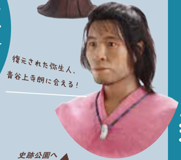
復元された弥生人、 青谷上寺朗に会える！

青谷上寺地遺跡を見て・触って・ 楽しく学べます。勾玉・くみひも・ 鏡づくりなどの弥生体験や、ミュー ジウムショップも楽しめます。