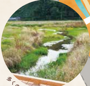
多くの生き物が棲む湿地